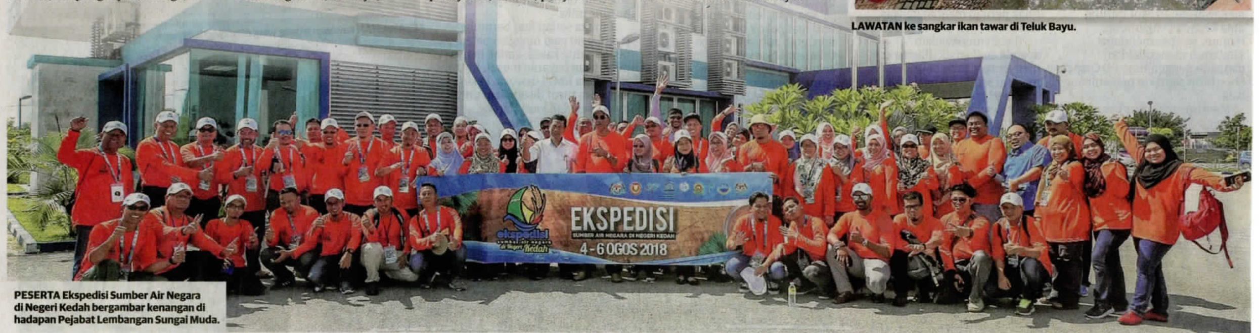
PESERTA Ekspedisi Sumber Air Negara di Negeri Kedah bergambar kenangan di hadapan Pejabat Lembangan Sungai Muda.