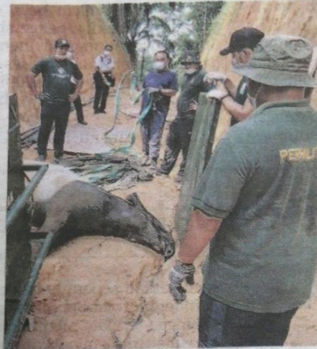
ANGGOTA Jabatan Perhilitan Negeri Sembilan ketika menyelamatkan seekor tapir yang patah kaki selepas dipercayai terjatuh dari tebing di sebuah kebun durian di Pantai, Seremban semalam.

Sementara itu, Wan Mat berkata, pada tahun ini sahaja, sebanyak empat ekor ta-