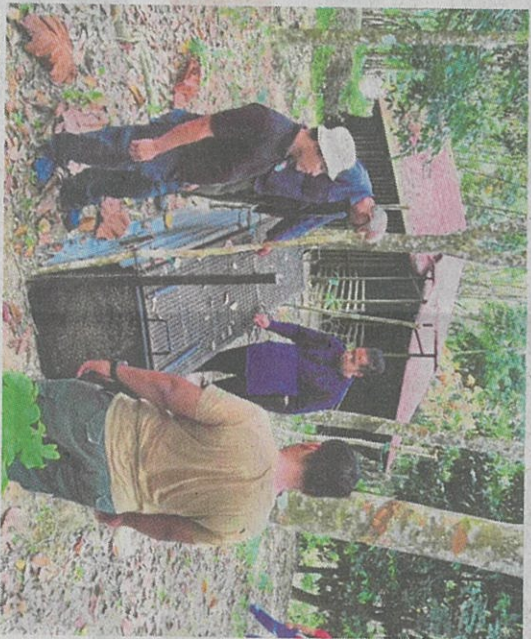
ANGGOTA PERHILITAN Negeri Sembilan menggunakan perangkap besi untuk menangkap harimau kumbung.

"Tiga kejadian serangan sebelum ini berlaku di luar kandang dan insiden terbaru ini adalah kejadian pertama haiwan pemangsa itu masuk ke dalam kandang," katanya.