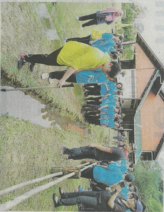
PESERTA digalakkan untuk mengalami proses pemuliharaan air sebenar selepas demonstrasi oleh para profesional.

"Justeru, amat penting untuk melindungi alam sekitar kita dan memastikan sumber air tulen dan bersih. Ini kerana air penting untuk memenuhi keperluan hidup dan menyokong mata pencarian seperti menghasilkan tanaman segar dalam bidang pertanian dan juga untuk haiwan ternakan.