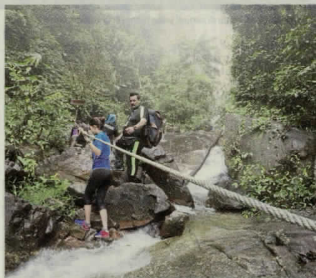
ANTARA aktiviti mencabar di sungai.

Nor Hisham berkata, pihak yang ingin membangunkan pelancongan eko berdekatan dengan sungai perlu mendapat kelulusan daripada pelbagai pihak