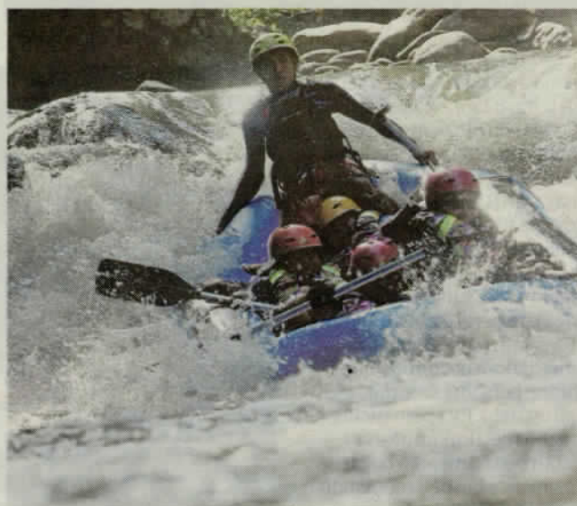
AKTIVITI berkayak arus deras antara aktiviti tarikan.

JPS dididik masyarakat setempat untuk lebih peka urus sampah supaya tidak berlaku pencemaran