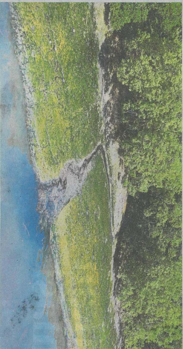
Pencemaran di Sungai Kim Kim, Pasir Gudang, Johor, pada tahun ini menjelaskan ramai pihak

"Kita mahu negara ini terkenal dengan alam sekitar yang indah dan sebagai negara Islam kita harus menzahirkannya," katanya.