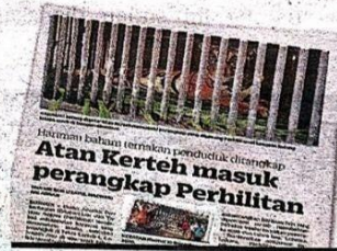
KERATAN Kosmo! semalam.

ra memasang perangkap sejak 10 hari lalu.