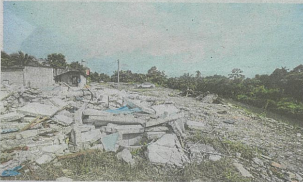
ANTARA rumah yang diroboh pihak berkuasa bagi memberi laluan projek Rancangan Tebatan Banjir Sungai Kedondong.

Rabu minggu lalu, sebanyak 36 rumah dirobohkan