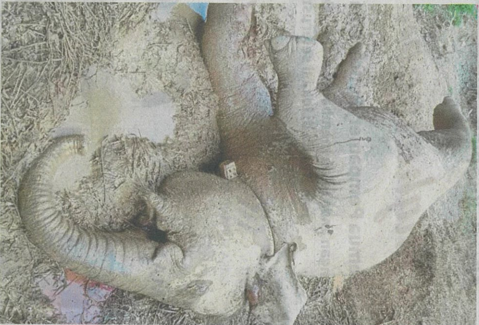
Girang ditemui mati di sebuah ladang di Sukan, Kinabatangan, kelmarin.

Beliau berkata kerajaan negeri juga akan menyemak semula undang-undang berkaitan dan meningkatkan kadar hukuman bagi memastikan kejadian seperti itu tidak berulang.