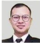
Pensyarah Kanan Sosiso-Perundangan dan Sains Kelestarian di Jabatan Pengajian Sains dan Teknologi, Fakulti Sains, Universiti Malaya (UM)

Oleh Dr Mohd Istajib Mokhtar bhrencana@bh.com.my