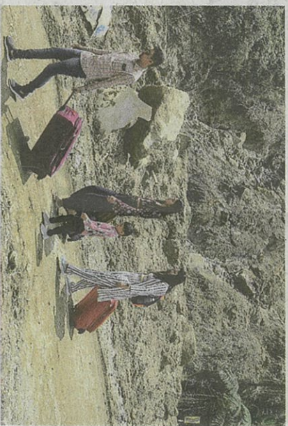
Pengujung pusat perancangan tanah tinggi terkenal itu terpaksa berjalan kaki melintasi kawasan kejadian tanah runtuh di Jalan Genting-Amber Court ketika tinjauan media semalam.