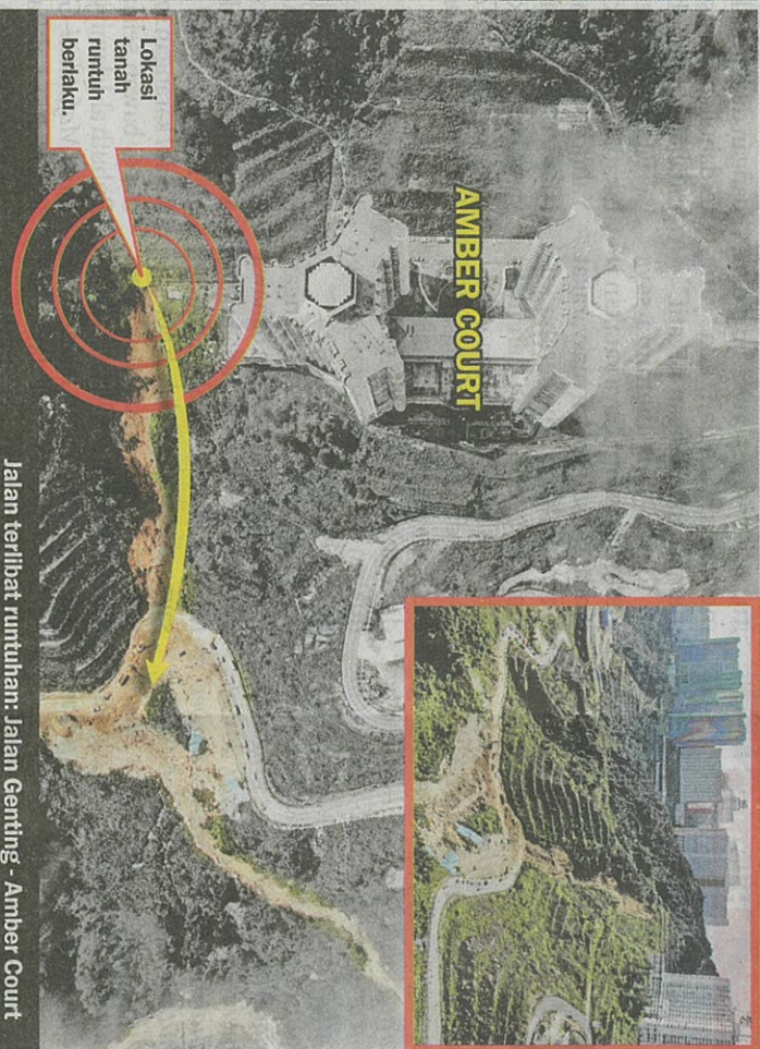
Jalan terlibat runtuh: Jalan Genting - Amber Court

"Setakat ini, mereka terpaksa jalan kaki ekoran keadaan laluan yang masih belum selamat untuk dibuka kepada kenderaan," katanya.