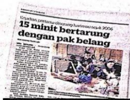
KERATAN Kosmo! 7 Julai 2021.

"Syamilla juga dipantau rapi oleh doktor veterinar Jabatan Perhilitan serta kakitangan NWRK bagi memastikan ia akan