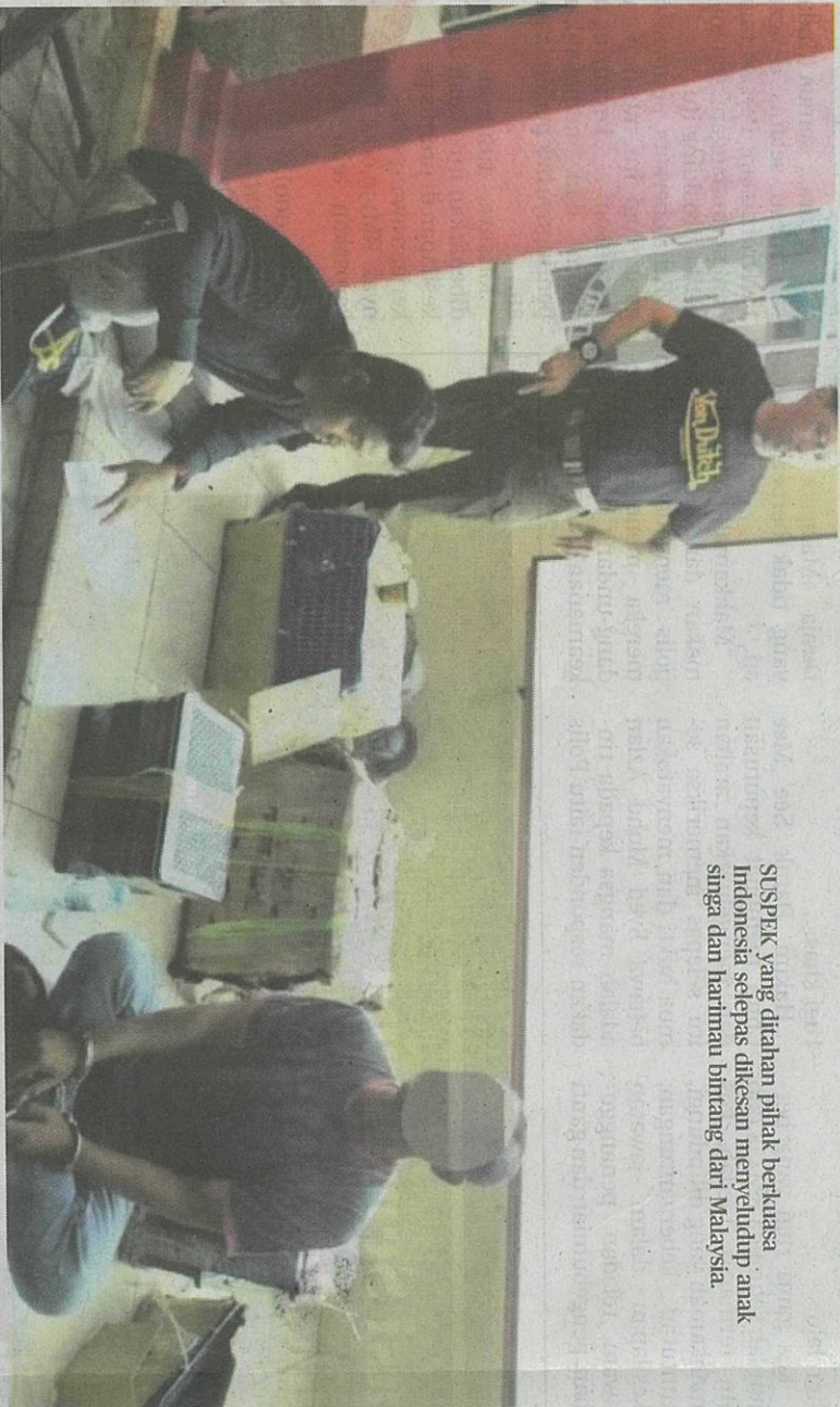
SUSPEK yang ditahan pihak berkuasa Indonesia selepas dikecas menyeludup anak singga dan harimau bintang dari Malaysia.

Menurutnya, haiwan liar itu diseludup menggunakan bot yang mendarat di pesisir 'pelabuhan tikus' berhampiran Dumai, Riau. "Siasatan mendapati, empat anak singga dan seekor