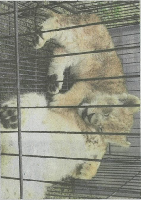
ANAK singga yang berjaya diselamatkan selepas diseludup dari Malaysia ke Riau, Indonesia.