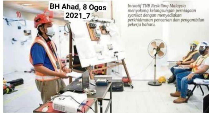
BH Ahad, 8 Ogos 2021.7

Sejak inisiatif itu diperkenalkan pada bulan Oktober 2020, lebih 1,700 kekosongan jawatan berjaya diisi dengan pembabitian lebih daripada 160 syarikat.