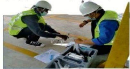
TNB ILSAS mempunyai Akedemi Dron yang boleh membantu memenuhi keperluan syarikat yang memerlukan jurutera drone.