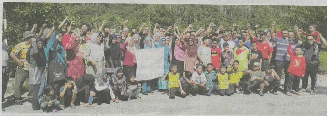
Penduduk Taman Chepor Sentosa berkumpul bagi membantah peneroka hutan Kledang Saiong yang dibimbangi akan memberi kesan buruk kepada mereka.