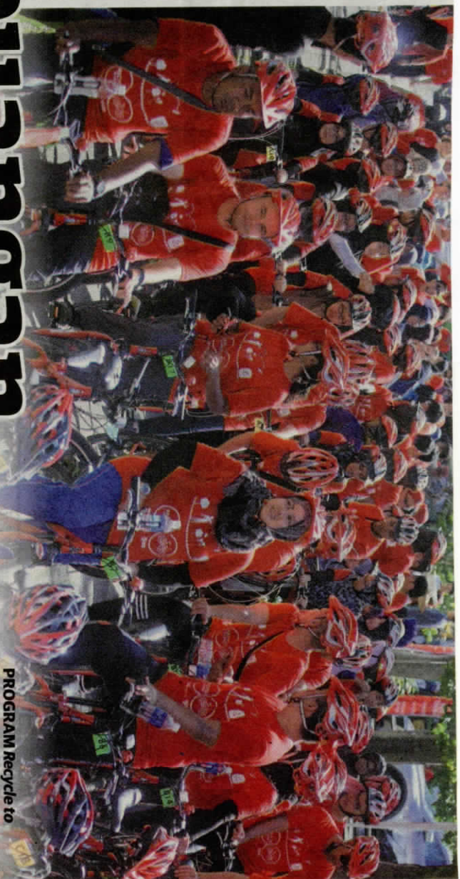
PROGRAM Recycle to Cycle diadakan bertujuan mempromosi kitar semula dan berbasikal dalam kampus di UPM.