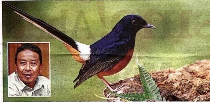
ABDUL KADIR (gambar kecil) menegaskan burung Murai Batu merupakan hidupan liar yang dilindungi Perhilitan dan menangkap serta memilikinya tanpa kebenaran merupakan satu kesalahan.

"Memang terdapat Murai Batu di Indonesia, tetapi spesies dari Malaysia dikatakan yang terbaik kerana memenuhi ciri yang diimpikan setiap peminat.