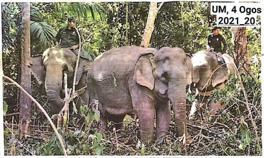
UM, 4 Ogos 2021 20