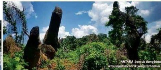
ANTARA bentuk tiang batu semula jadi menarik yang terbentuk.

PERCA Kain Project adalah projek terbaharu PNW dalam merekodkan gua-gua dan formasi.