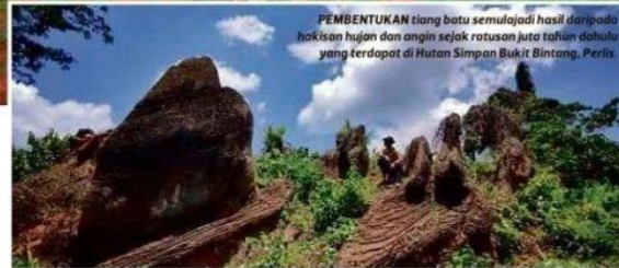
PEMBENTUKAN tiang batu semula jadi hasil daripada hakisan hujan dan angin sejak ratusan juta tahun dahulu yang terdapat di Hutan Simpan Bukit Bintang, Perlis.

Pulau Langkawi sebelum ini diisytiharkan sebagai sebuah Geopark oleh Global Geopark Network (GGN) yang bernaung bawah Pertubuhan Bangsa-Bangsa