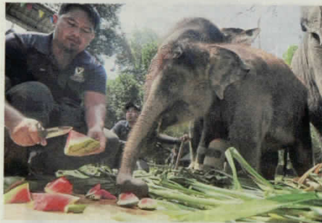
ELI juga gemar menikmati tembikai selain rumput nepial.