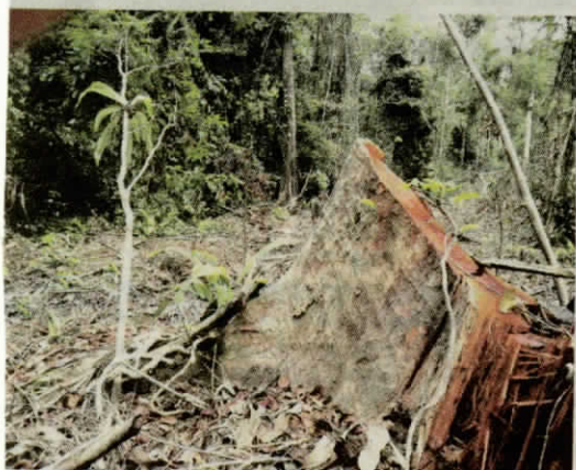
Balak yang ditebang.

Justeru, terdapat hanya sedikit aktiviti pembangunan di Kelantan pada 1990-an. Lebuhraya, jalan raya dan empangan yang telah dirancang dan sepatutnya dibina dibatalkan. Akibatnya, pertumbuhan ekonomi Kelantan telah terbantut, dan peluang pekerjaan terhad. Kesannya, telah berlaku penghijrahan beramai-ramai penduduk tempatan keluar dari Kelantan dalam tempoh ini. Beratus ribu rakyat Kelantan terpaksa berhijrah keluar mencari pekerjaan. Kini, dianggarkan setiap satu daripada tiga orang, daripada 1.5 juta rakyat Kelantan tinggal dan bekerja di luar negeri tersebut. Jika Mahathir bertujuan menghukum Pas dan Tengku Razaleigh, rakyat Kelantanlah sebenarnya yang telah menjadi mangsa.