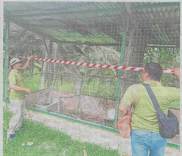
KAKITANGAN SFC turut menyelamatkan burung helang yang disimpan secara haram.

Orang ramai yang mempunyai maklumat berkenaan perdagangan hidupan liar digalakkan membuat laporan menerusi hotline SFC di talian 016-8565564 / 019-8859996 (Kuching), 019-8883561 (Sibü), 019-8223449 / 019-8332737 (Bintulu) dan 019-8290994 / 018-9799778 (Miri).