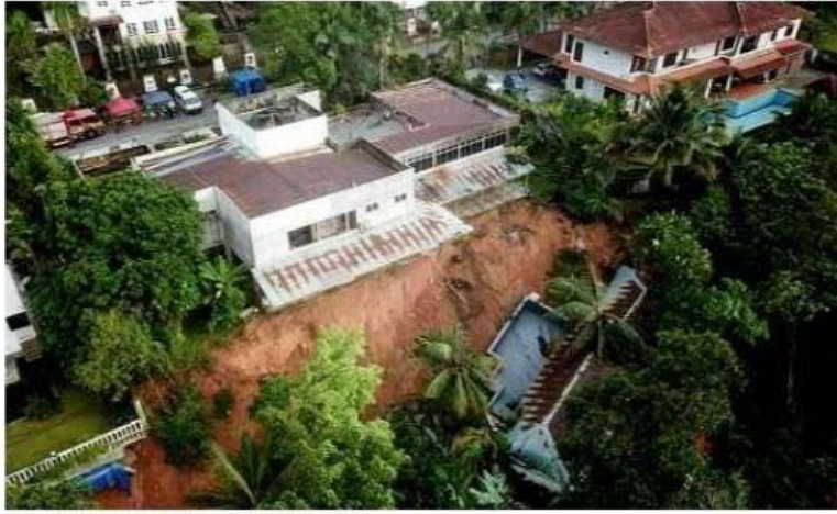
KEADAAN tanah runtuh di Kemensah Heights.