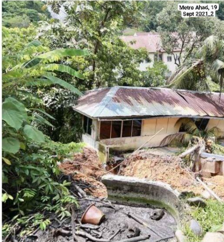
SEBUAH kediaman yang musnah dalam kejadian tanah runtuh di Kemensah Heights.

Oleh Raja Noraina Raja Rahim dan Muhaamad Hafis Nawawi am@hmetro.com.my