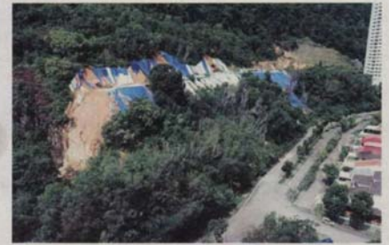
Gambar dari arah udara menunjukkan runtuh di lereng bukit diakibatkan penerokaan hutan dan bukit yang rakus.