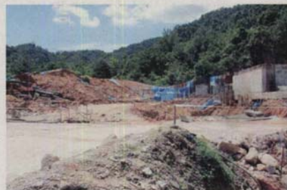
Kawasan pembinaan di lereng bukit.

nyatakan, laporan kepada Suruhanjaya Pencegahan Rasuah Malaysia (SPRM) akan dibuat untuk menyasiat setiap kelulusan diberikan pihak-pihak berkenaan di mana beliau tidak menolak kemungkinan wujud salah guna kuasa.