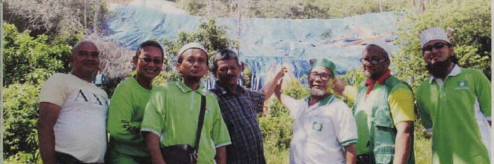
KEJAR PEMBANGUNAN Lereng bukit yang runtuh, PAS Pulau Pinang telah membuat tinjauan isu itu baru-baru ini selepas banjir besar melanda negeri itu bulan lepas.