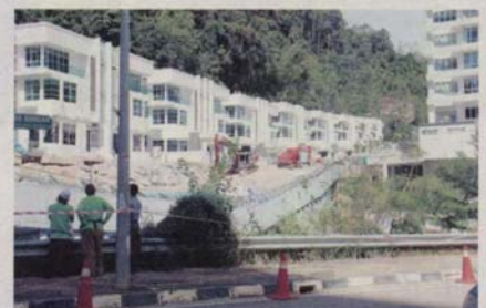
Kawasan pembinaan yang dihentikan sementara akibat runtuh tanah.

mentar bahawa situasi dihadapi jelas menunjukkan pihak kerajaan negeri terlalu mengutamakan pihak pemaju. Mereka berpendapat, pihak kerajaan gagal mewujudkan kawalan sepatutnya, malah mungkin melindungi kesalahan pemaju dari melaksanakan peraturan pembinaan ditetapkan.