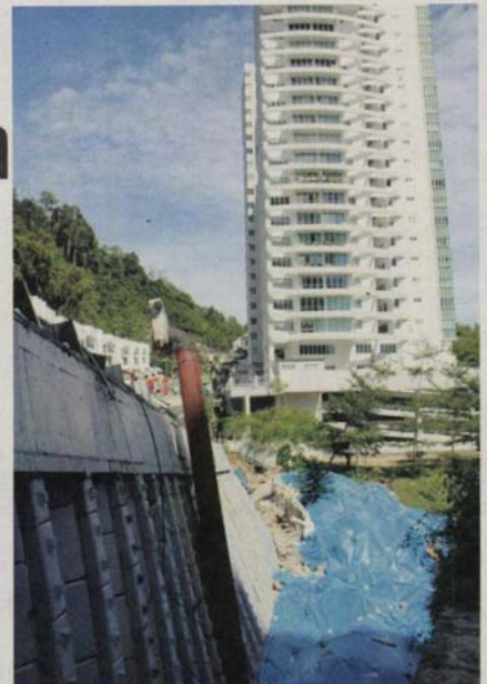
Perumahan mewah cerun bukit yang belum diduduki tetapi struktur jalannya telah runtuh.